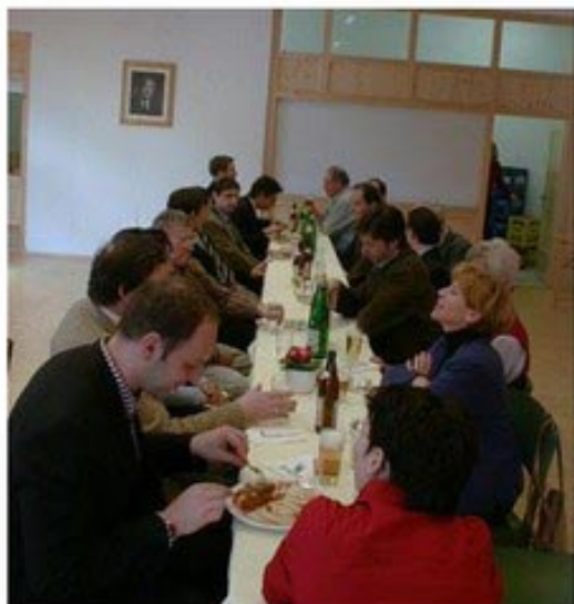
Mittagstisch bei der Firma Haslacher Drauland Holzindustrie